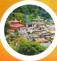
GALESHWOR TEMPLE MYAGDI