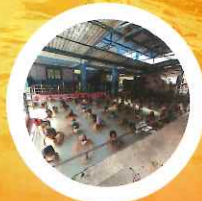
NATURAL HOT SPRING TATOPANI KUNDA MYAGDI